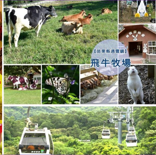
【苗栗縣通霄鎮】 飛牛牧場

飞牛牧场+DIY 活动*义大游乐世界 1 票玩到底*凤梨酥 DIY 猫空缆车*十分车站体验放天灯